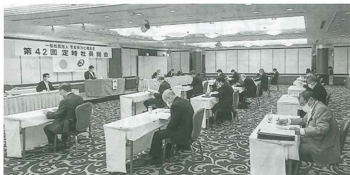
定時社員総会の様子