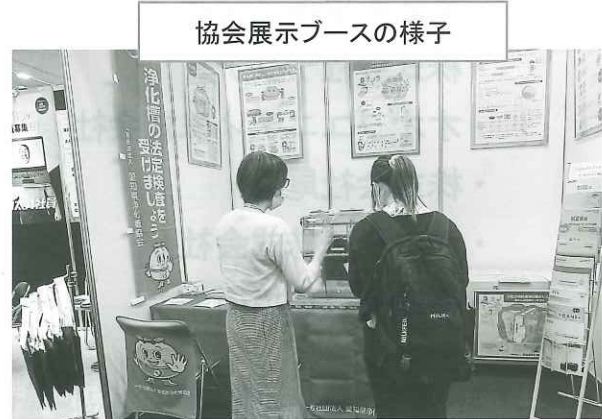
協会展示ブースの様子

建築企業や関連団体など61社・団体が出展し、建築材料や住宅設備機器など時代に即した最新の建築材や施工技術の情報が紹介されました。総入場者数は約3,380人。