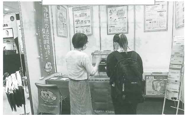
協会展示ブースの様子

建築企業や関連団体など61社・団体が出展し、建築材料や住宅設備機器など時代に即した最新の建築材や施工技術の情報が紹介されました。総入場者数は約3,380人。